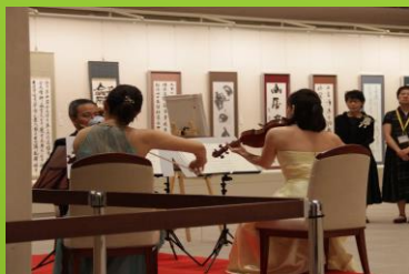
成田山書道美術館