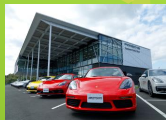
Porsche Experience Center Tokyo