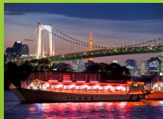
เรือน้ำเที่ยวสโตร์ญี่ปุ่น