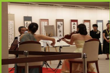
พิพิธภัณฑ์ศิลปะการเขียนฟูกันนาริระซัง