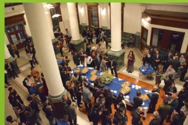
พิพิธภัณฑ์ศิลปะอำเภอชิบะ

"Unique Venue" คือสถานที่ที่โดดเด่น เช่น อาคารทางประวัติศาสตร์และอาคารแบบดั้งเดิม ตลอดจนสถานที่ด้านศิลปะและวัฒนธรรมที่มอบประสบการณ์ด้านศิลปะสุดพิเศษ โดยใช้เป็นสถานที่สำหรับการพบปะสังสรรค์ขนาดใหญ่ เช่น การประชุมทางธุรกิจและงานกาล่า ผู้เข้าร่วมทุกท่านจะได้สัมผัสประสบการณ์ด้านศิลปะ วัฒนธรรม และประวัติอันยาวนาน ฯลฯ ที่ยอดเยี่ยม และโปรดใช้ประโยชน์จากพื้นที่เมืองอันประณีตและอาคารแบบดั้งเดิมของจังหวัดชิบะเหล่านี้