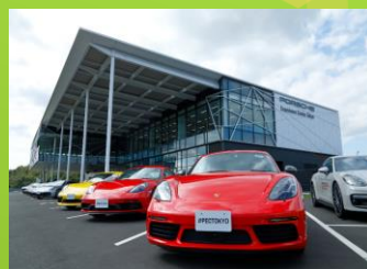
東京保時捷主題樂園